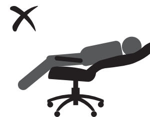
НЕ ОПИРАЙТЕСЬ НА СПИНКУ