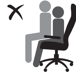
КРЕСЛО НЕ РАССЧИТАНО ДЛЯ ДВОИХ ЛЮДЕЙ!