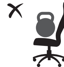
НЕ ПРЕВЫШАТЬ ДОПУСТИМЫЙ ВЕС