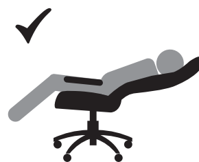
ВЕС ДОЛЖЕН БЫТЬ РАСПРЕДЕЛЕН НА ВСЕ СИДЕНЬЕ