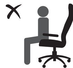
НЕ СИДИТЕ НА КРАЮ