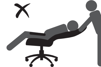
НЕ ОПИРАЙТЕСЬ НА СПИНКУ