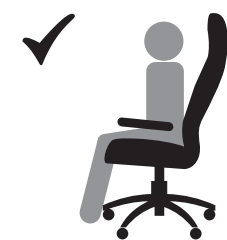
СИДИТЕ НА ВСЕМ СИДЕНИИ